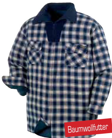
Thermohemd-Jacke mit Reißverschluss