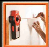
Anbringen von Wandleuchten im Raum